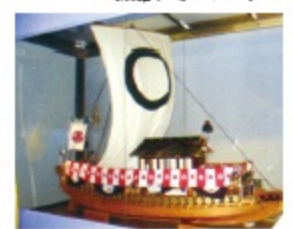
▲高松藩御座船 飛龍丸