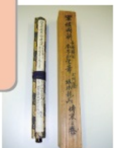
▲西洋軍艦構造分解図説

ふね もけいてんじ ●船模型展示 ひりゅうまる かんりんまる にっぼんまるほか (飛龍丸・咸臨丸・日本丸他) ●操船シミュレーター せいようぐんかんこうぞうぶんかいずせつ ●西洋軍艦構造分解図説