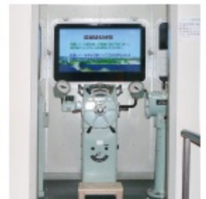
▲操船シミュレーター

ふね もけいてんじ ●船模型展示 ひりゅうまる かんりんまる にっぼんまるほか (飛龍丸・咸臨丸・日本丸他) ●操船シミュレーター せいようぐんかんこうぞうぶんかいずせつ ●西洋軍艦構造分解図説